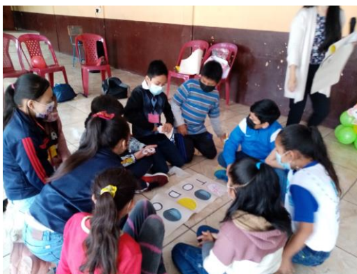
Niños y niñas en actividades de formación en derechos humanos

Se realizaron tres actividades especiales: Rally de los Derechos en el centro alternativo de la FPP y Feria de los Derechos en la Escuela Rubén Darío y una caminata por el derecho a la educación.